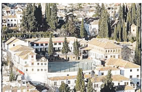
Ave Maria Casa Madre – hiszpańska szkoła w Granadzie

Projekt ma na celu zdobycie wiedzy i doświadczenia w warunkach międzynarodowych w tematyce związanej z promocją zdrowia w kontekście odżywiania, aktywności fizycznej, ryzyka uzależnienia od internetu, a także z ideą integracji społecznej uczniów zdrowych wobec uczniów z zaburzeniami rozwoju. Poprzez działa-