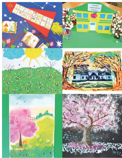
Gminna Biblioteka Publiczna w Samborcu KOCHAM TĘ ZIEMIĘ konkurs plastyczny on-line

uwagę na oryginalny pomysł i estetykę wykonania. Poziom był bardzo wyrównany, w związku z tym podjęto decyzję o przyznaniu nagród równorzędnych. Wśród laureatów konkursu znalazły się dzieci i młodzież oraz grupy przedszkolne i klasy ze szkół podstawowych z terenu naszej gminy. Zwycięzcy otrzymali fantastyczne nagrody książkowe.