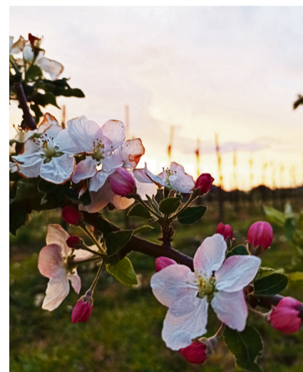
Ulotna chwila (Ostrołęka).

Dziękujemy jury, wszystkim, którzy wzięli udział w konkursie, a zwycięzcom gratulujemy! Zapraszamy też do obejrzenia filmiku przedstawiającego wyniki konkursu oraz prezentację wszystkich