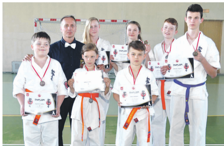
Nasi na turnieju w Hrubieszowie.

16 kwietnia 2018 w Kielcach wójt gminy Samborzec Witold Surowiec odebrał z rąk wojewody świętokrzyskiej Agaty Wojtyśzek promesę dotacyjną przeznaczoną na usuwanie skutków klęsk żywiołowych.